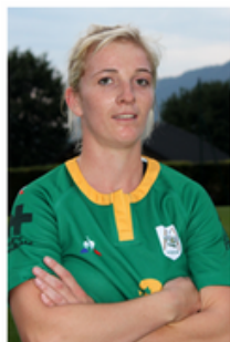
Educatrice Adjointe :