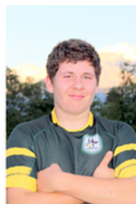
Educateur Adjoint :