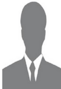
Educateur Adjoint :